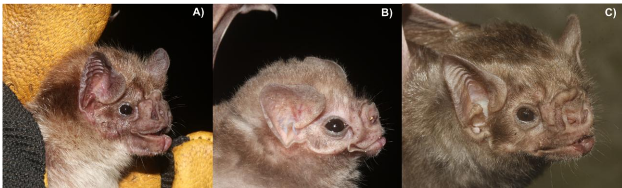
Figura 1. Espécies de morcegos hematófagos: A) morcego-vampiro ( Desmodus rotundus ); B) morcego-vampiro-de-perna-peluda ( Diphylla ecaudata ); C) morcego-vampiro-de-asa-branca ( Diaemus youngi ).

Se ainda existem dúvidas, os vampiros não existem. O que, sim, existem são os morcegos hematófagos. Esses são exclusivamente latino-americanos e habitam desde o norte do México até o sul da América do Sul, em países como Colômbia, Brasil, Peru, Argentina e Chile (WILSON & REEDER, 2005; KWON & GARDNER, 2008; BARQUEZ et al. , 2015). Todos pertencem à subfamília Desmodontinae (Chiroptera: Phyllostomidae) e, até hoje, só existem três espécies descritas (Figura 1): o morcego-vampiro [ Desmodus rotundus (Geoffroy, 1810)], o morcego-vampiro-de-perna-peluda ( Diphylla ecaudata Spix, 1823) e o morcego-vampiro-de-asa-branca [ Diaemus youngi (Jentink, 1893)]. Assim, à medida que nos aprofundamos no mundo dos morcegos latinos que se alimentam de sangue, é difícil imaginar um vampiro caucasiano tradicional ao pensar em um humano que se transforma em morcego hematófago (Figura 2).