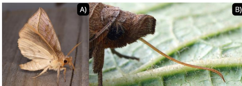
Figura 3. A) Mariposa hematófaga Calyptra thalictri , foto de Александр Корепанов. B) Probóscide de C. thalictri , foto de Cossus. Ambas com licença CC BY-NC 4.0 Attribution-NonCommercial 4.0 International Deed. Fonte: iNaturalist.

Simuliidae, Phlebotominae – Diptera), percevejos (família Reduviidae – Hemiptera) ou piolhos (Anoplura), mas a hematofagia também é reportada em outros vertebrados, como peixes (lampreias) e até aves! Como no caso do tentilhão-vampiro ( Geospiza septentrionalis Rothschild & Hartert, 1899 – Passeriformes: Thraupidae) das Ilhas Galápagos. Essa ave é onívora, mas em momentos de escassez de recursos pode se alimentar de sangue de outras aves; seu intestino possui uma microbiota parecida com a dos morcegos hematófagos e é um animal tão peculiar que já foi citado em livros de cultura popular (MEEHAN, 2014; MICHEL et al. , 2018; SONG et al. , 2019). Outro caso extremo e fascinante de hematofagia é o das mariposas-vampiro, porque, quando pensamos em insetos que se alimentam de sangue, o primeiro que vem à mente são os mosquitos, mas algumas mariposas do gênero Calyptra Ochsenheimer, 1816 (Lepidoptera: Erebiidae) também são hematófagas (Figura 3).