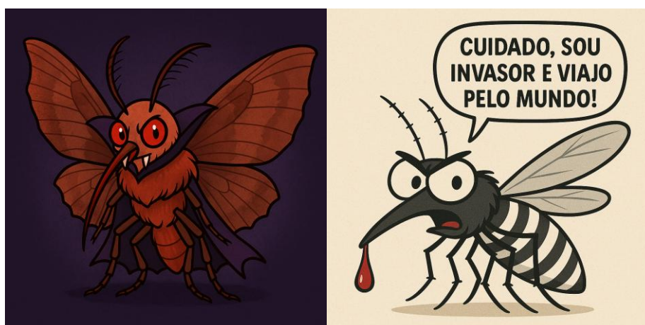
Figura 4. Caricaturas de uma mariposa vampiro e do mosquito-tigre [ Aedes albopictus (Skuse, 1894)], originário do sudeste asiático, conhecido como espécie invasora em diversos continentes.

Diferentes dos nossos amigos morcegos hematófagos, essas mariposas vivem na Ásia, na África e em partes da Europa. Apesar de se alimentarem majoritariamente de frutas, algumas têm a capacidade de perfurar a pele de mamíferos, incluindo animais grandes e ocasionalmente humanos, para sugar sangue. O mais curioso é que essa conduta é observada apenas nos machos, que possuem uma probóscide especializada com ganchos e farpas. Esse órgão funciona como uma serra dupla: suas duas metades se alternam para rasgar a pele, atingir os vasos sanguíneos e gerar uma pequena poça subcutânea de onde bebem. No caso de Calyptra thalictri (Borkhausen, 1790), foi observado que podem penetrar até seis milímetros abaixo da pele e permanecer se alimentando por até uma hora (PLOTKIN & GODDARD, 2013). Assim, a existência de hematófagos (Figura 4) nos lembra o quão versátil a evolução pode ser: adaptações inusitadas que alteram hábitos tradicionais para aproveitar novos recursos.